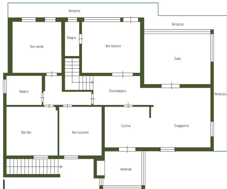
Casa Intera mq 230