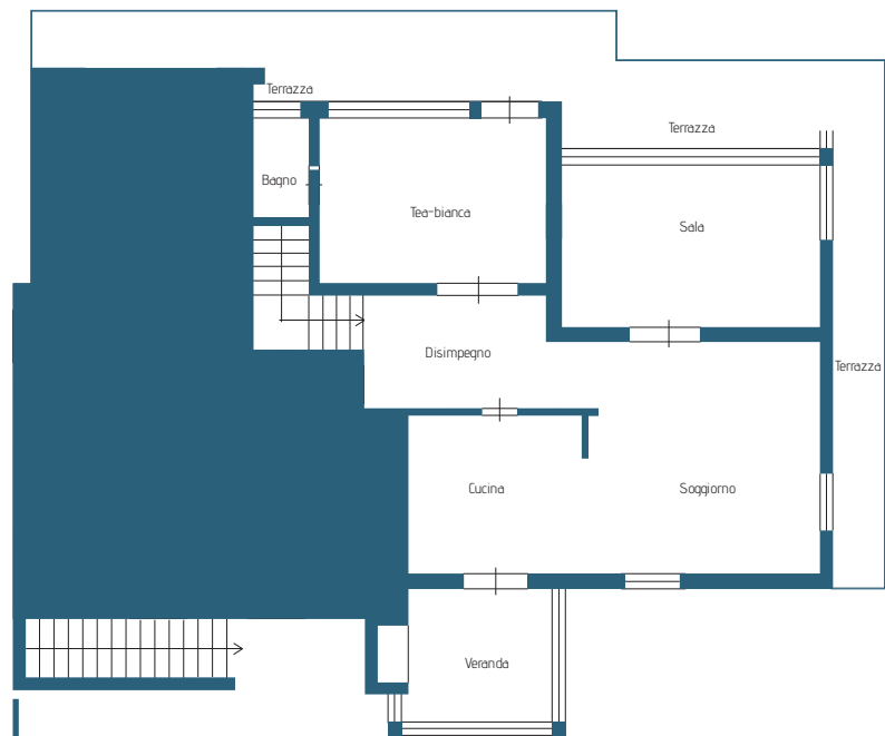
Uso singola mq 170